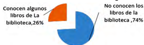
Gráfica No 3. Conocimiento de los libros que hay para leer en la biblioteca del colegio

Además, se pudo establecer que el 74% de los estudiantes no conoce los libros que se encuentran en la biblioteca del colegio y el 26% restante, conoce sólo alguno de los libros (ver gráfica 3) y no existe en todo el bachillerato ni un solo rincón de lectura, lo cual impide el acceso a los libros de forma casi total.