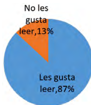
Gráfica No 1. Encuesta a estudiantes. Curso 6 - 1

Es interesante contrastar este relato donde se hace evidente la apatía demostrada en la clase hacia la lectura con lo que respondieron en el cuestionario en el cual el 87 % de los estudiantes manifestaron que les gusta leer y el 13% dijeron que no (ver gráfica 1).