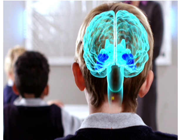
Figura 2. Científicos del Proyecto Cerebro humano afirman que están investigando el cerebro con tecnología no invasiva, como la Resonancia magnética funcional (Izq), no con implantes cerebrales, se muestra una recreación gráfica de un implante cerebral en niño en clase (derecha).

Izquierda: https://sites.google.com/site/tecnicasdeneuroimagen/