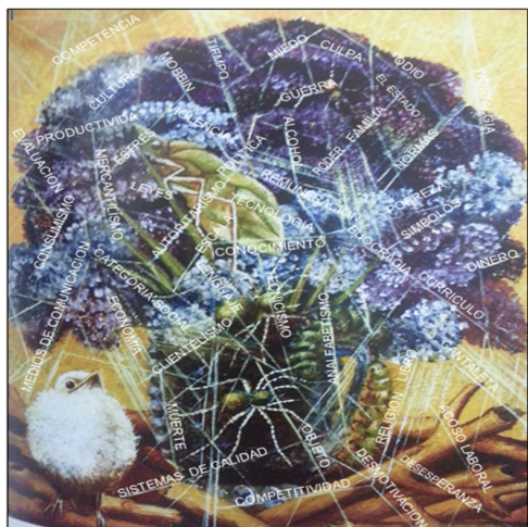
“El polluelo”. Frida Kahlo. Oleo/Tela 1945. Museo Dolores Olmedo