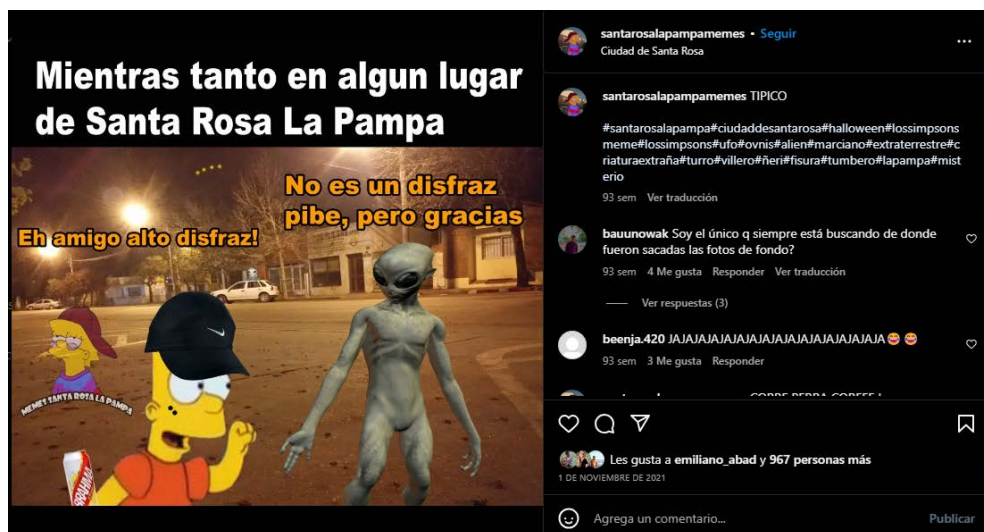
Imagen 1. Meme: Mientras tanto en algún lugar de Santa Rosa.

En el meme “Mientras tanto en algún lugar de Santa Rosa”, (@santarosalapampamemes, 2025) la imagen (ver imagen 1) está dividida en tres partes: un texto superior que indica: “Mientras tanto en algún lugar de Santa Rosa La Pampa”; en primer plano, un alienígena interactúa con Bart Simpson (personaje de Los Simpson 5 ) que, aparentemente alcoholizado, le dice: “Eh amigo alto disfraz”. El alienígena responde: “No es un disfraz pibe, pero gracias”. En segundo plano, una calle desierta y oscura de Santa Rosa. La publicación tiene 968 me gusta.