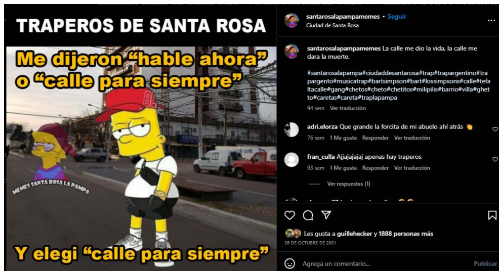
Imagen 7. Calle para siempre

Nota: captura de pantalla de la autora a partir del sitio de Instagram @santarosalapampamemes, 2024.