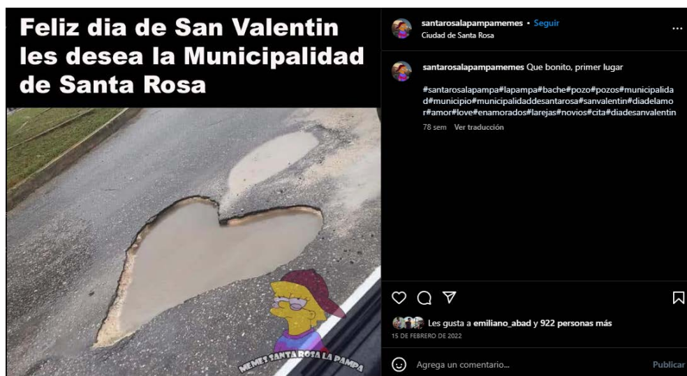
Imagen 5. Día de San Valentín

En tercer lugar, analizamos el meme “Día de San Valentín” (2024) (ver imagen 5) que contiene un texto superior que dice: “Feliz día de San Valentín les desea la Municipalidad de Santa Rosa” (@santarosalapampamemes 2024). La imagen muestra un enorme bache en forma de corazón, en una publicación que recibió 923 me gusta.