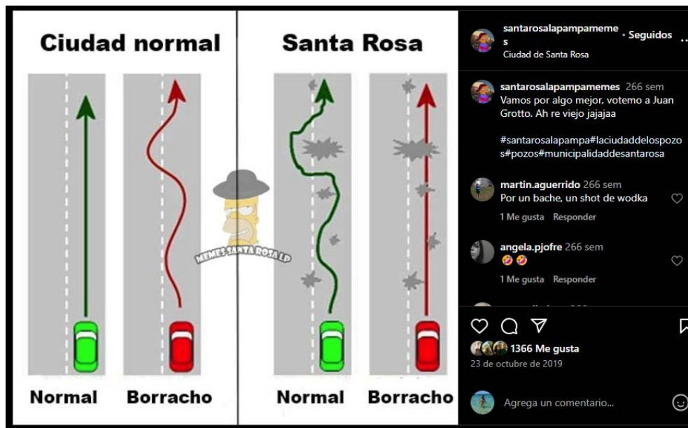
Imagen 4. Ciudad normal vs. Santa Rosa.