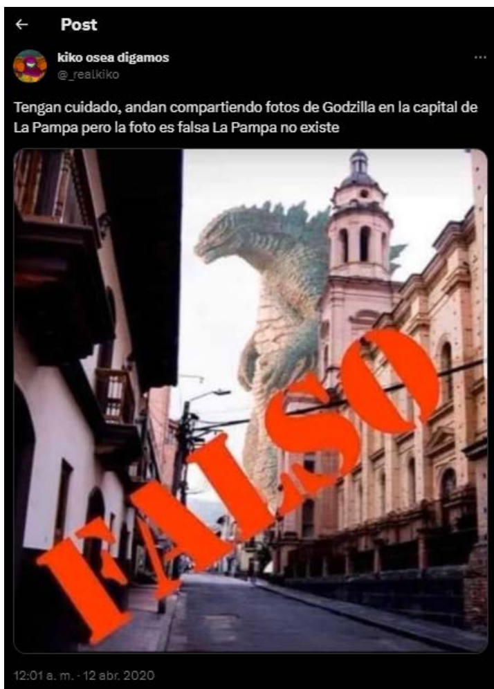
Imagen 2. Godzilla en La Pampa

Un segundo meme analizado es el que presenta a Godzilla en La Pampa (2024) (ver imagen 1). En este, se afirma: “Tengan cuidado, andan compartiendo fotos de Godzilla en la capital de La Pampa, pero la foto es falsa, La Pampa no existe” (@_realkiko, 2024). Silva (2006) afirma que la ciudad es una construcción simbólica antes que una entidad física; en ese sentido, hay una identificación a través de este meme circulado en Santa Rosa, respecto de la ciudad, pero en el marco de una provincia.