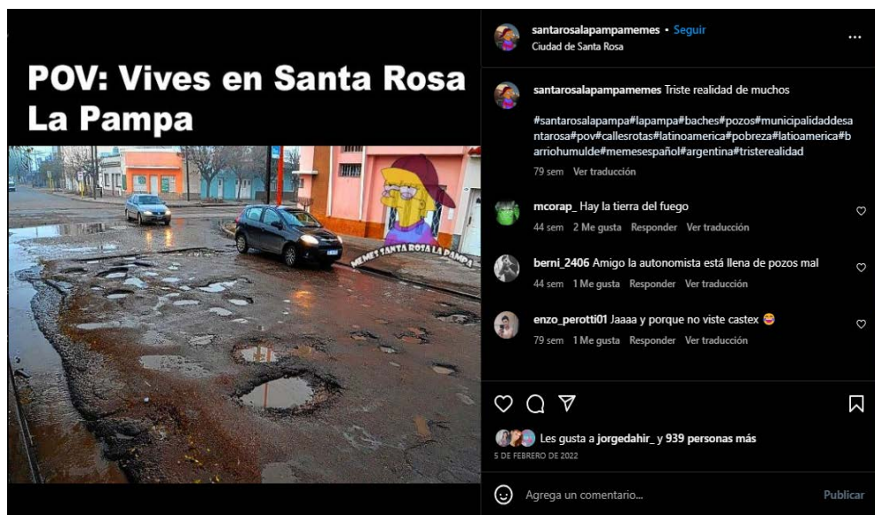
Imagen 6. Triste realidad

En cuarto y último lugar para esta sección donde se analiza la percepción de la ciudad de Santa Rosa, se seleccionó el meme Triste realidad (2024) (ver imagen 6). Lleva por texto “POV: Vives en Santa Rosa La Pampa” (@santarosalapampamemes, 2024), que encabeza una imagen de una calle deteriorada, cubierta de baches con agua acumulada por la lluvia. La descripción agrega: “Triste realidad de muchos”. La publicación de Instagram recibió 940 me gusta.