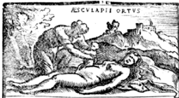
Extracción de Esculapio del vientre de su madre Coronis , por su padre Apolo . Relieve en madera de la edición « De Re Medica », de Alessandro Benedetti .

La vara de Esculapio , o sea una vara con una serpiente enroscada, apareció como emblema unos 800 años a.c., en tiempos de Homero . Según la mitología, Esculapio era hijo de Apolo y de Coronis ; ésta era hija de Flegias , rey de Tesalia . Encolerizado Apolo porque Coronis estaba enamorada del hijo de Eratos , cuando nació su hijo lo dejó abandonado en el Monte Titón , donde una cabra cuidaba de su nutrición y un perro de su seguridad. Un pastor encontró al niño y lo entregó al cuidado del centauro Girón , quien le enseñó la medicina y a partir de ahí sus poderes curativos se vuelven famosos en todo el país.